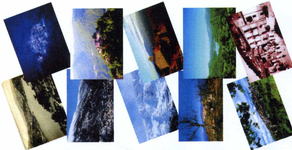
Immagini di paesaggi del Cicolano