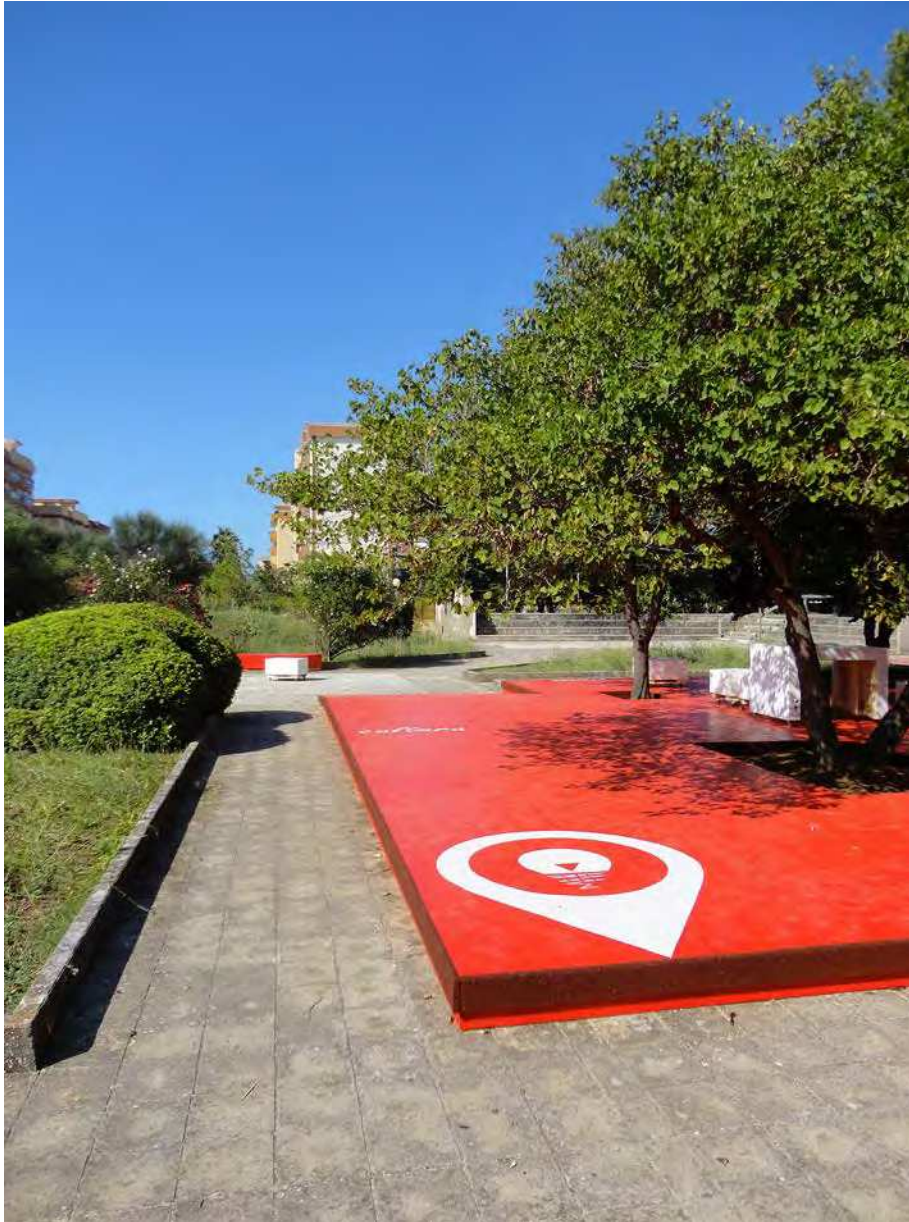
6. La pedana con il simbolo della creatività