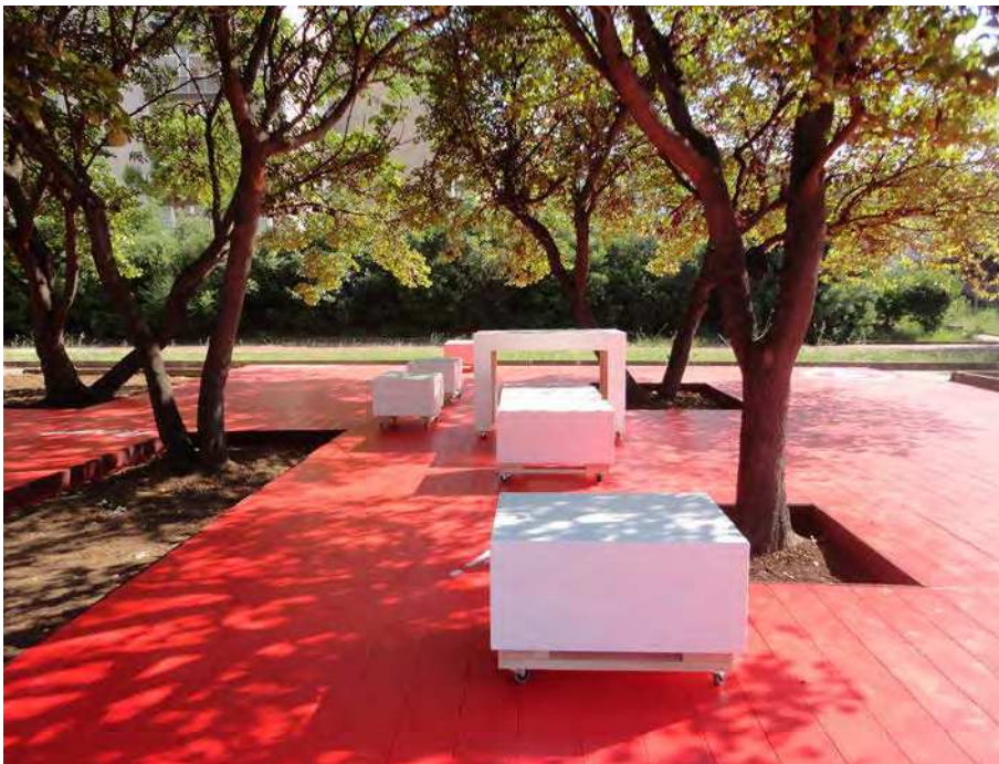
8. La pedana con gli arredi mobili

Lo spazio del giardino è poi punteggiato da panche e tavoli mobili, elementi puntuali bianchi che creano un forte contrasto visivo quando si sovrappongono alla pedana rossa.