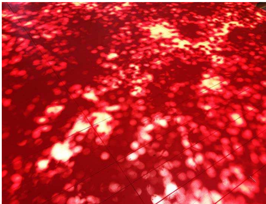
4. L'ombra degli alberi sulla pedana rossa

Qui è stata realizzata una pedana di legno rossa composta da elementi modulari, su cui gli alberi creano un gioco vibrante di luci e ombre.