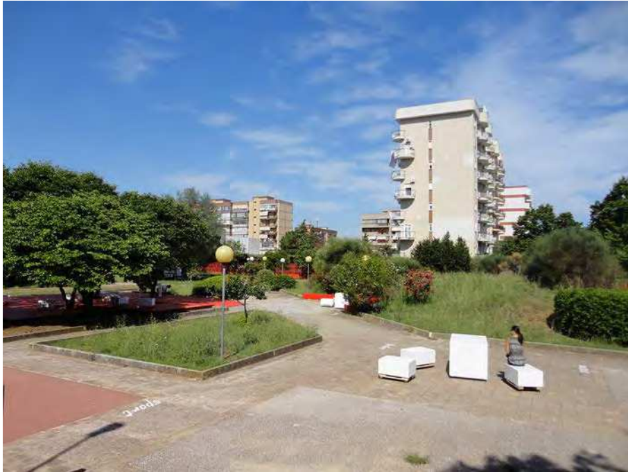
1. Vista generale dell'intervento

Il giardino dell'Istituto Verga infatti ha una potenzialità molto forte di spazio pubblico aperto alla città, perché dotato di due ingressi indipendenti dall'edificio scolastico che consentono di gestire le attività all'aperto in modo autonomo. Il giardino può così diventare un luogo di incontro e di aggregazione sociale in grado di ospitare attività diverse, aperte anche alla comunità locale. Prima dell'intervento gli spazi aperti versavano in condizioni critiche e non erano previste specifiche attività didattiche all'aperto, dunque il potenziale del giardino non era valorizzato con il conseguente spreco di una risorsa preziosa sia per la scuola sia per la città.