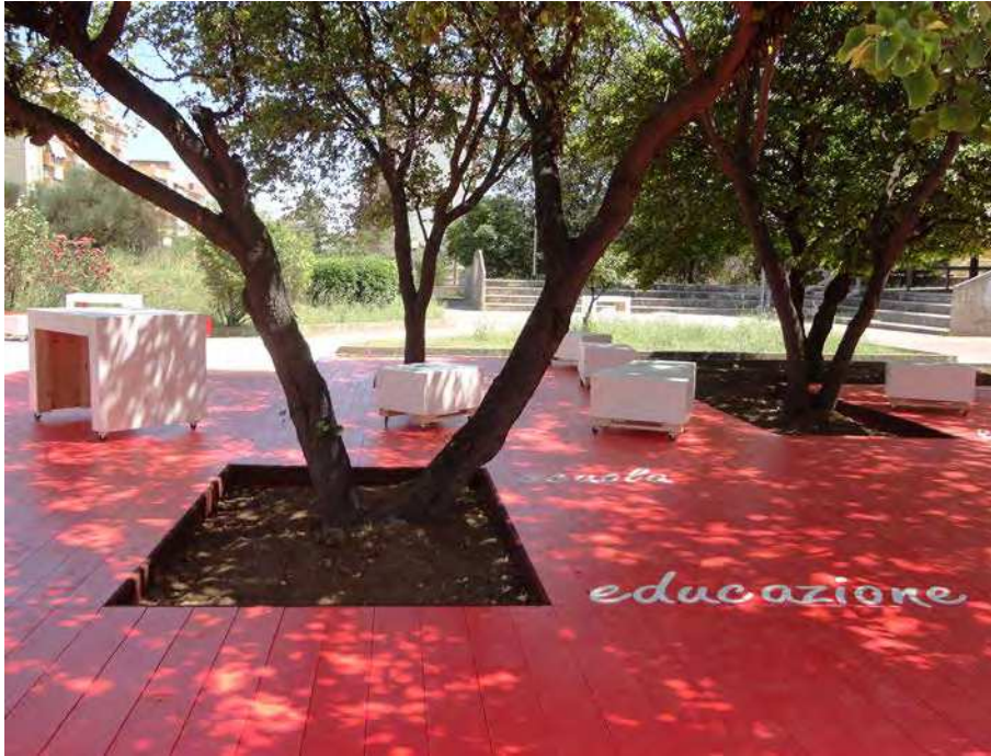
7. La pedana con le parole chiave della CRC

Il giardino è poi punteggiato da una serie di parole tratte dagli articoli della Carta dei Diritti del bambino dell'ONU (CRC) che richiamano i valori dell'infanzia, organizzati in un percorso ricco di rimandi che conduce al centro del giardino. Questo tema è stato concordato e sviluppato con gli educatori, quindi fortemente connesso ai contenuti della didattica.