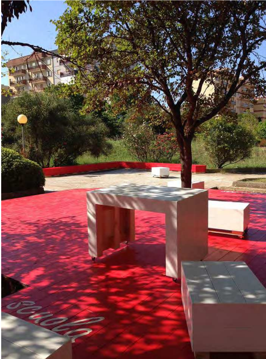
10. La pedana rossa