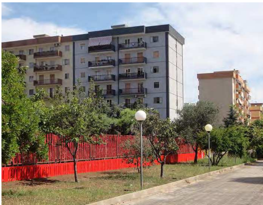
9. La recinzione con il nastro rosso

Il giardino è pensato come luogo per il gioco. Le parole dalla CRC riprodotte a terra pongono l'attenzione sui temi importantissimi del documento, all'interno di una visione in chiave gioiosa del luogo e della vita.