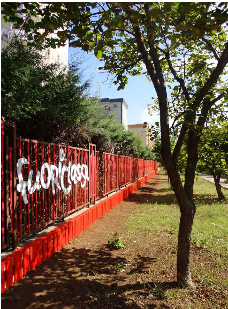
5. La recinzione con il nastro rosso

Alle superfici orizzontali e verticali si sovrappone una grafica bianca, composta da segni e simboli dipinti che guidano nell'esplorazione del giardino: i simboli dell'orto e della creatività identificano immediatamente le aree dedicate alle diverse attività.